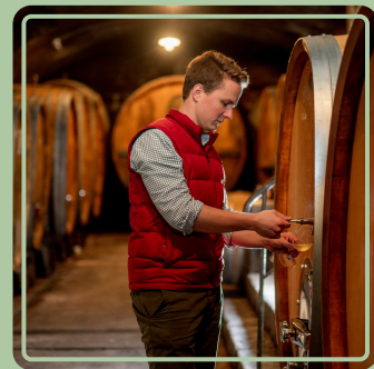
Weinprobe mit dem Winzer