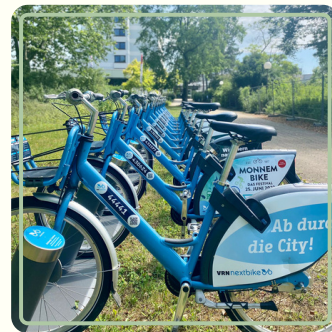
Fahrradtour Grünes LU