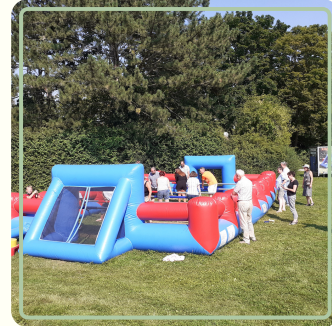
XXL Menschenkicker/ Indoor Fußball