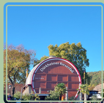
Bad Dürkheim erleben inkl. Wein- oder Sektprobe