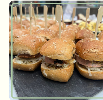
HPH Grill-Bufferet oder leckere Pfälzer Tapas