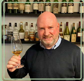
Whiskey- oder Gin -Tasting