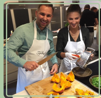
Koch-Event im KochGut Pfalz