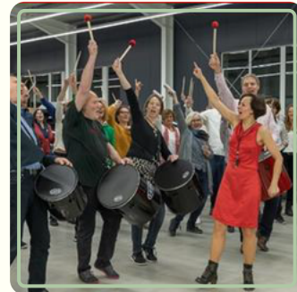
Samba Team Drumming by Anne Damm